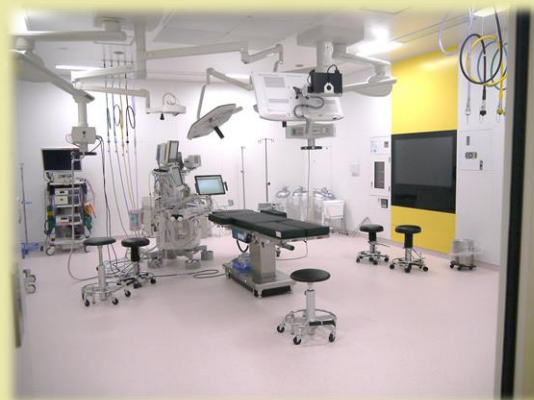
より安全な最新の手術室へと生まれ変わりました。