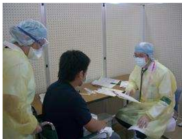
《新型インフルエンザパンデミック訓練の様子》

①新型インフルエンザを診療するための防御機材、薬剤の備蓄とスタッフの勤務態勢をどうしたらよいか？②患者家族との接触方法は？③帰宅時の職員家族の防御策などについて、もっと具体的に考える必要があることが山積みです。