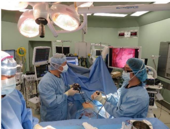
単孔式胸腔鏡手術の術野風景

若手外科医が、働きやすく、勉強しやすく、患者さんのための医療を実践できる環境、女性外科医が安心して、育児と仕事が両立して活躍できるようなシステム、環境整備を行っております。