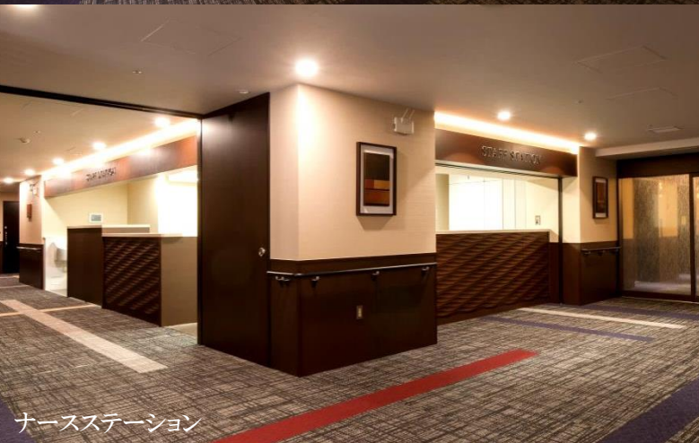
ナースステーション