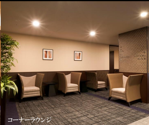
コーナーラウンジ