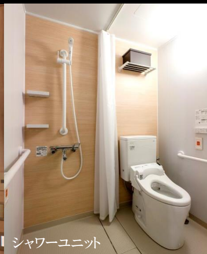
シャワーユニット